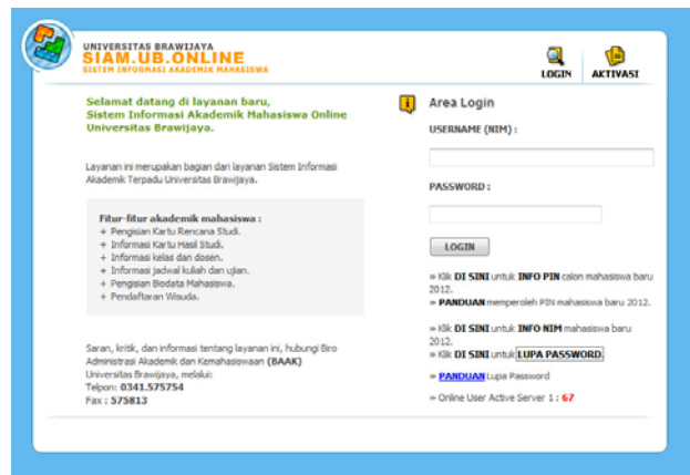
Halaman depan SIAM

Panduan ini akan membantu Anda dalam proses pengisian kuisisioner perkuliahan, yang ada di SIAM UB.